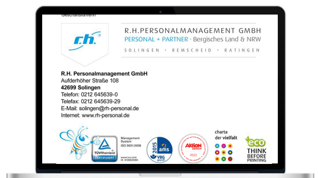
Verwendung in der E-Mail-Signatur