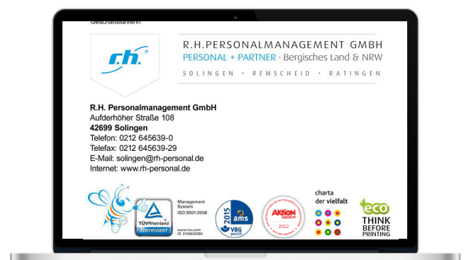
Verwendung in der E-Mail-Signatur