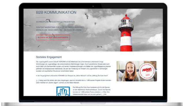
Verwendung auf der Website

Ob auf Ihrer Webseite oder in Ihrem E-Mail-Footer – das Aktion Mensch-Siegel ist vielseitig einsetzbar und wirkt. Hier zwei Beispiele aus der Praxis: