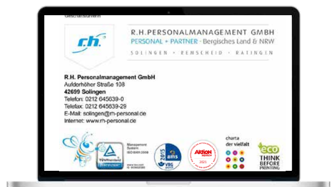
Verwendung in der E-Mail-Signatur