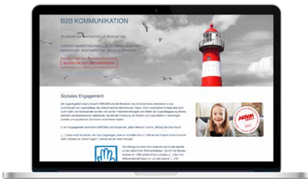
Verwendung auf der Website

Ob auf Ihrer Webseite oder in Ihrem E-Mail-Footer – das Aktion Mensch-Siegel ist vielseitig einsetzbar und wirkt. Hier zwei Beispiele aus der Praxis: