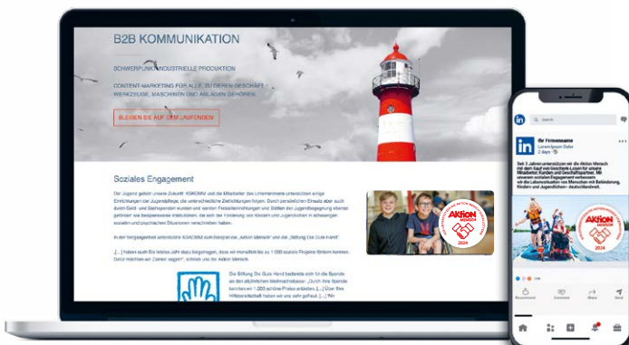
Verwendung auf Webseite und Social-Media-Kanal

Ob auf Ihrer Webseite, in Ihrem E-Mail-Footer oder auf Ihrem Social-Media-Kanal – das Aktion Mensch-Siegel ist vielseitig einsetzbar und wirkt. Hier haben wir Beispiele aus der Praxis: