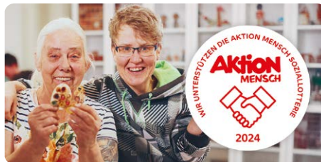
Förderung älterer Menschen