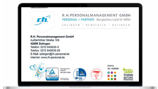
Verwendung in der E-Mail-Signatur