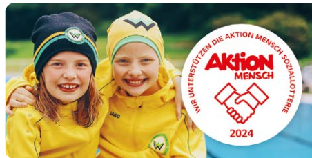
Kinder- und Jugendprojekte