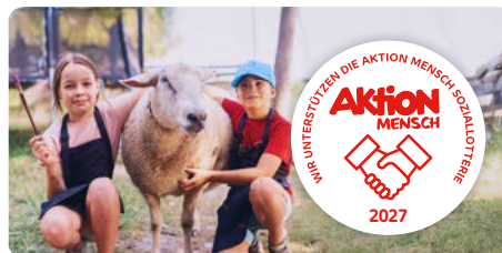
Kinder- und Jugendprojekte