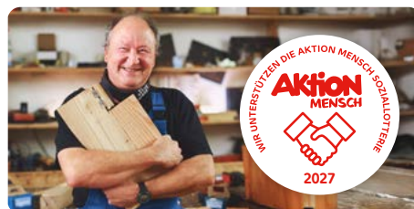
Förderung ältere Menschen