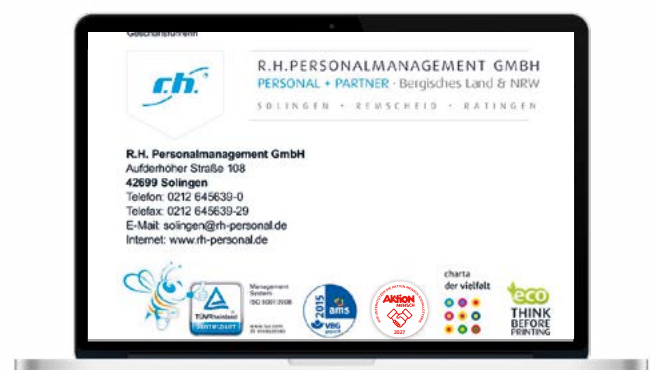
Verwendung in der E-Mail-Signatur