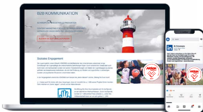
Verwendung auf Webseite und Social-Media-Kanal

Ob auf Ihrer Webseite, in Ihrem E-Mail-Footer oder auf Ihrem Social-Media-Kanal – das Aktion Mensch-Siegel ist vielseitig einsetzbar und wirkt. Hier haben wir Beispiele aus der Praxis: